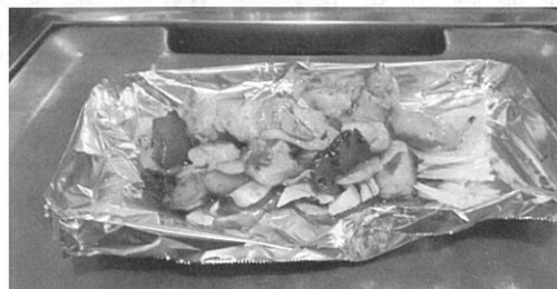
鳥もものにんにく焼き