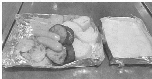
チーズフォンデュ